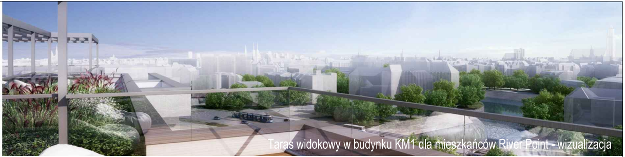
Taras widokowy w budynku KM1 dla mieszkańców River Point – wizualizacja

KM3-1/4/3/2k · 2 pokoje · 53.6 m 2 · 4. piętro · PB