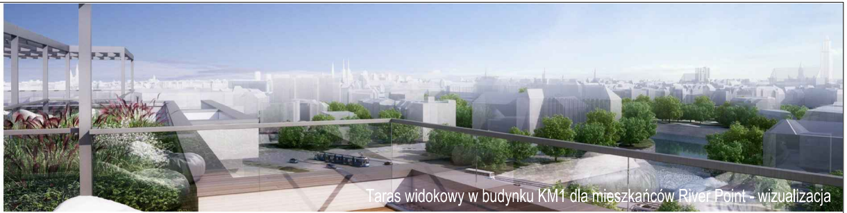
Taras widokowy w budynku KM1 dla mieszkańców River Point - wizualizacja

KM2-3/8/6/3k · 3 pokoje · 67.6 m 2 · 8. piętro · PB