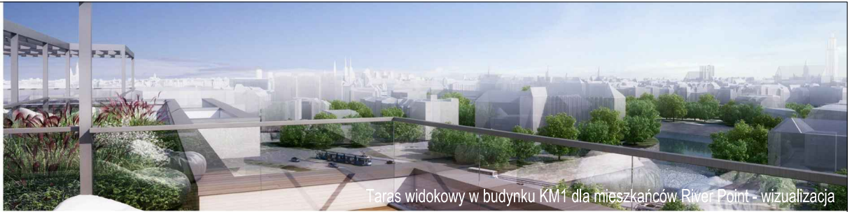
Taras widokowy w budynku KM1 dla mieszkańców River Point - wizualizacja

KM2-3/6/6/3k · 3 pokoje · 67.6 m 2 · 6. piętro · PB