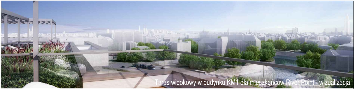
Taras widokowy w budynku KM1 dla mieszkańców River Point - wizualizacja

KM2-3/3/5/3a · 3 pokoje · 57.2 m 2 · 3. piętro · PB