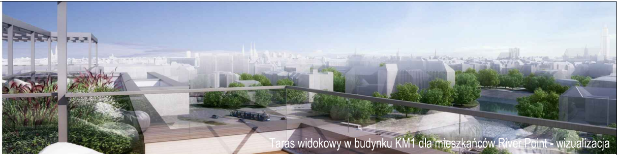
Taras widokowy w budynku KM1 dla mieszkańców River Point - wizualizacja

KM2-3/2/5/3a · 3 pokoje · 57.2 m 2 · 2. piętro · PB