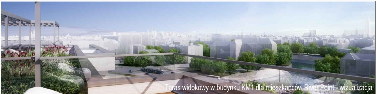
Taras widokowy w budynku KM1 dla mieszkańców River Point - wizualizacja

KM2-2/5/3/2a · 2 pokoje · 37.8 m 2 · 5. piętro · PB