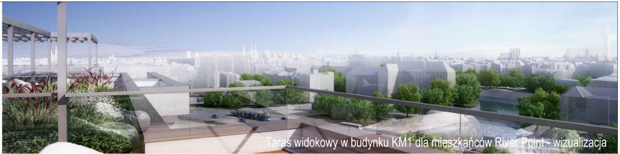
Taras widokowy w budynku KM1 dla mieszkańców River Point – wizualizacja