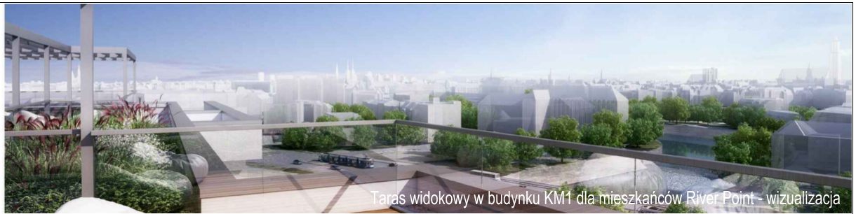
Taras widokowy w budynku KM1 dla mieszkańców River Point - wizualizacja

KM2-1/8/1/5a · 5 pokoi · 146.5 m 2 · 8. piętro · PB