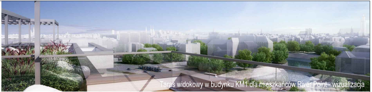
Taras widokowy w budynku KM1 dla mieszkańców River Point – wizualizacja

KM2-1/7/6/2k · 2 pokoje · 55.1 m 2 · 7. piętro · PB