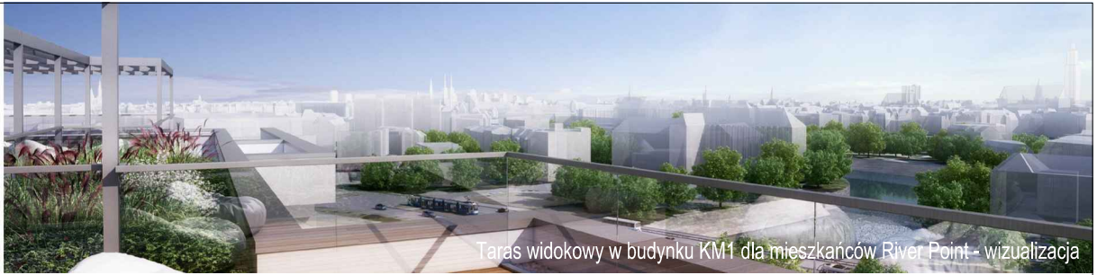
Taras widokowy w budynku KM1 dla mieszkańców River Point - wizualizacja

KM2-1/4/6/2k · 2 pokoje · 55.1 m 2 · 4. piętro · PB