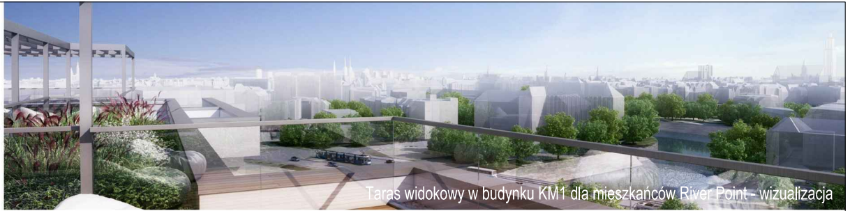
Taras widokowy w budynku KM1 dla mieszkańców River Point – wizualizacja