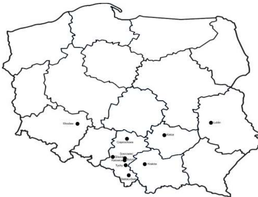
Największe skupiska uczestników MLS

MLS to około 200 biur pośrednictwa w obrocie nieruchomościami. Największe skupiska uczestników Systemu to Górny Śląsk, Wrocław, Lublin, Kielce i Częstochowa. W Systemie uczestniczą także poszczególne biura z pozostałej części Polski).